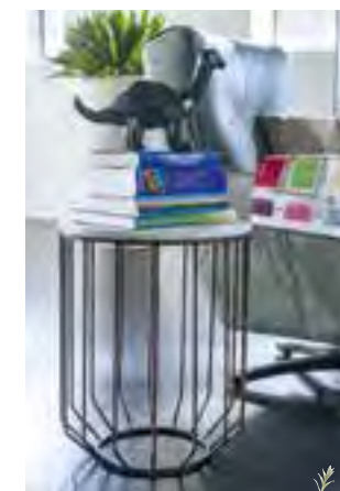
Beistelltisch Elise, Höhe 49cm € 119

2,5-SITZER SAVONA in Stoff ab € 1199,-* | in Leder ab € 2199,-* (ohne Kissen) | in verschiedenen Ausführungen, Stoff- und Ledersorten sowie Farben möglich Auswahl aus Standard- Fuß oder Design-Fuß (Mehrpreis € 100,-) | (elektrisch) verstellbare Sitzfläche wahlweise und USB-Anschluß oder Taschenfederkern (gegen Mehrpreis wahlweise | COUCHTISCH mit Drehplatte ab € 649,- | Auswahl aus 3 Farben Wildeiche, Deckplatte in massivem Holz oder Betonoptik SESSEL ROSKILDE in Stoff ab € 499,- | in Leder ab € 599,- (ohne Kissen) (abgebildet in Stoff Savannah und Cuba Leder) | Auswahl aus vielen Stoff- und Ledersorten, Wahl von Edelstahlfüßen oder Drehfuß Metall edelstahlfarben oder schwarz | LOWBOARD 200cm mit Deckplatte aus massivem Holz € 1199,- mit Deckplatte in Betonoptik € 1349,- | Mehrpreis LED Flurbeleuchtung € 89,-** | auch verfügbar in: 140cm und 170cm | Auswahl aus 3 Farben Wildeiche und Handgriff in Holz oder Metall | SIDEBOARD 240cm mit Deckplatte aus massivem Holz € 1699,- | mit Deckplatte in Betonoptik € 1899,- | Mehrpreis LED Flurbeleuchtung € 89,-** | auch verfügbar in: 190cm und 220cm | Auswahl aus massivem Wildeichenholz in 3 Farbtönen und Handgriff in Holz oder Metall