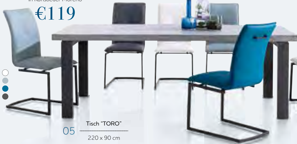
05 Tisch "TORO" 220 x 90 cm €999