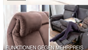
FUNKTIONEN GEGEN MEHRPREIS

2,5-SITZER, ca. 190 cm, fest. Relaxfunktion, Kopfteilverstellung und weitere Funktionen gegen Mehrpreis. Ohne Kissen und Deko.