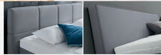
2 KOPFTEILVARIANTEN ZUR AUSWAHL

ORIGINAL BOXSPRING LIEGEKOMFORT DER SPITZENKLASSE!