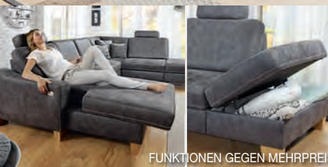
FUNKTIONEN GEGEN MEHRPREIS