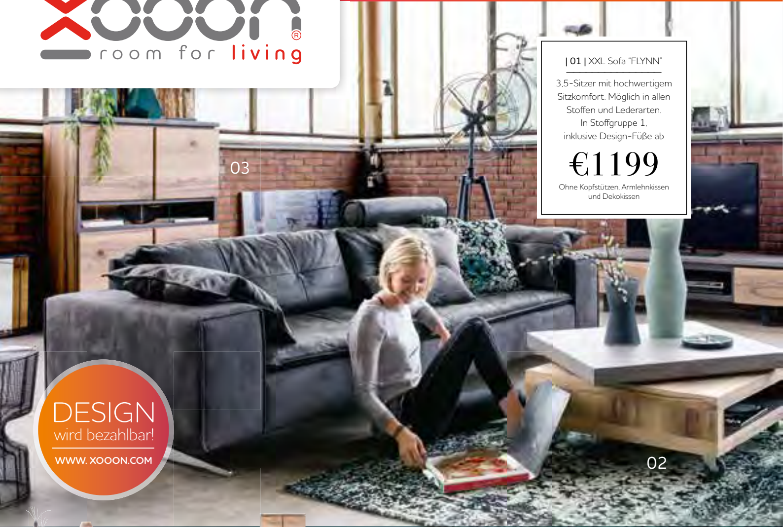
| 01 | XXL Sofa "FLYNN"

3,5-Sitzer mit hochwertigem Sitzkomfort. Möglich in allen Stoffen und Lederarten. In Stoffgruppe 1, inklusive Design-Füße ab