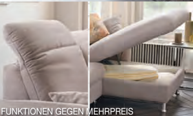
FUNKTIONEN GEGEN MEHRPREIS