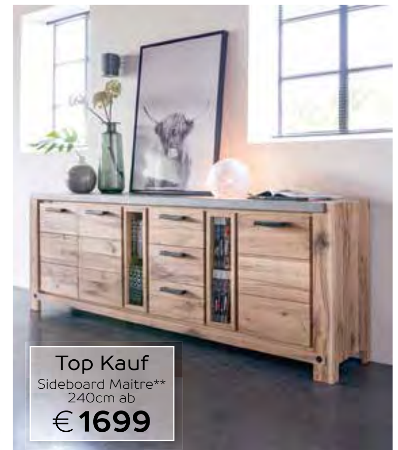
Top Kauf Sideboard Maitre** 240cm ab € 1699