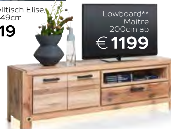
Lowboard** Maitre 200cm ab € 1199