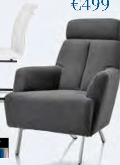
06 Sessel "SUNDERLAND" Mit Edelstahl-Gestell ab €499