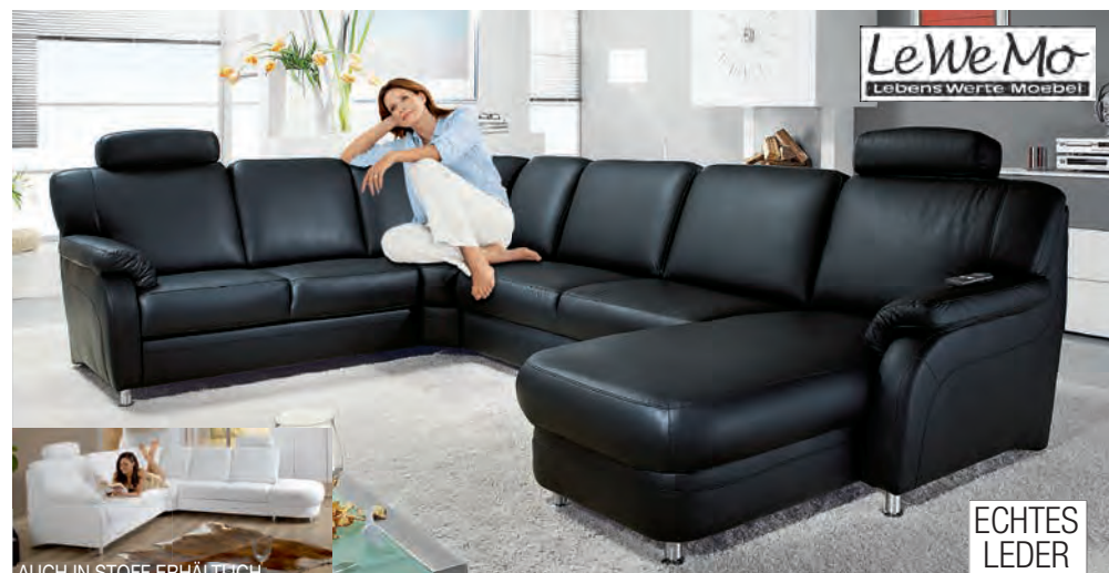
FUNKTIONEN GEGEN MEHRPREIS